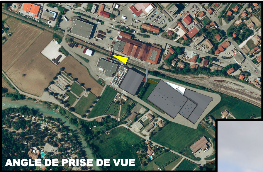
ANGLE DE PRISE DE VUE